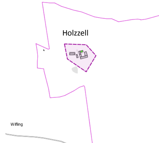
Detailkarte EG 3 = Los 2