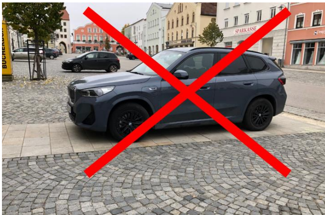
Auto wurde nur zu demonstrationszwecken so geparkt!

Autos die auf diesen Zugangswegen stehen behindern Fußgänger, Kinderwagenschieber und natürlich auch Personen mit Gehhilfen und Rollatoren gefahrlos und behindertengerecht zum Überqueren der Durchgangsstraße zu kommen.