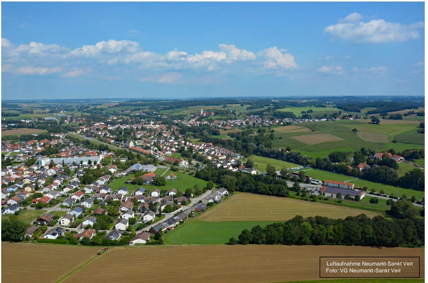
Luftaufnahme Neumarkt-Sankt Veit

VERWALTUNGSGEMEINSCHAFT NEUMARKT-SANKT VEIT